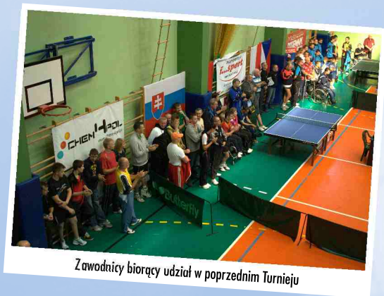
Zawodnicy biorący udział w poprzednim Turnieju

Miejsce turnieju: Hala Sportowa MOSIR Żywiec ul. Zielona 7