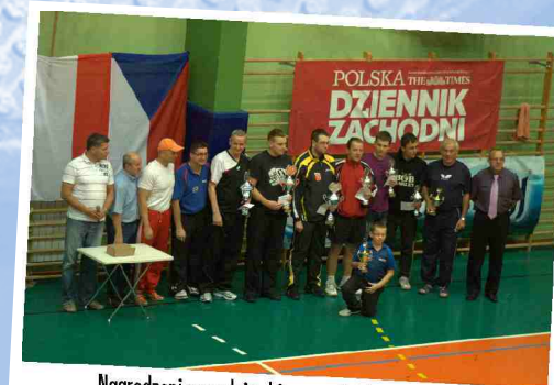
Nagrodzeni zawodnicy biorący udział w IX Turnieju wraz ze sponsorami i Zarząd Klubu LITSTS Anders

Przykładem jest z pewnością organizacja 10 już z kolei Międzynarodowego Integracyjnego Turnieju Tenisa Stołowego, który bez wsparcia sponsorów, Urzędu Miasta Żywca, Starostwa Powiatowego byłby wręcz niemożliwy do przeprowadzenia. Nie bez znaczenia jest również rola mediów, które na bieżąco informują społeczeństwo o uzyskiwanych wynikach sportowych przez naszych tenisistów.